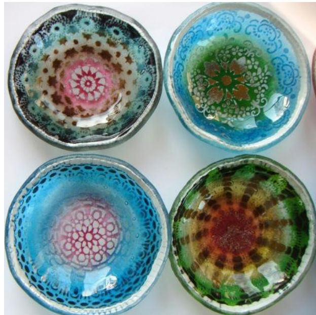
Wzory z różnych współczesnych pracowni.