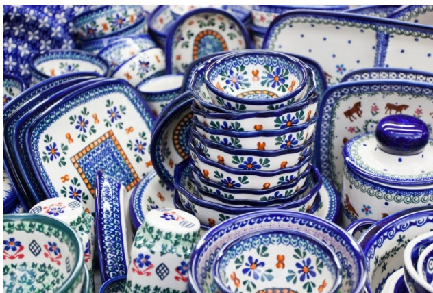
Ceramika z Bolesławca